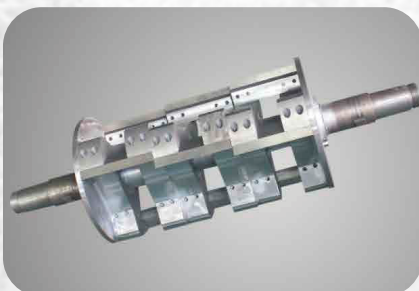
CUCHILLA DE CORTE PLANO