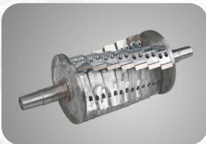
CUCHILLA DE CORTE DE GARRAS